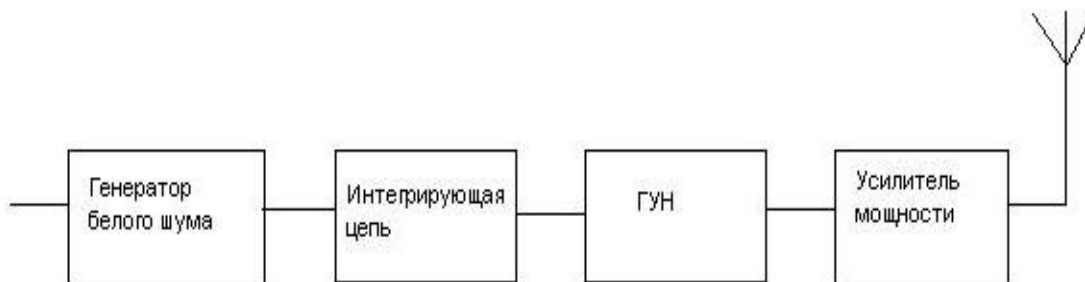
Рис. 1 – Структурная схема блокиратора GSM

Объемные иллюстративные материалы могут быть вынесены в приложения.