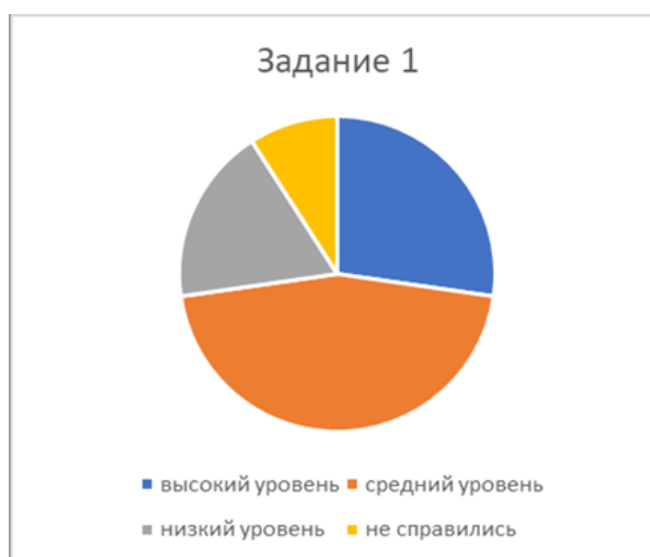
Рис.1. Диаграмма, отражающая распределение степени освоения детьми заданной темы

Примеры оформления результатов исследования с использованием средств текстового редактора (рис.1, 2, 3).