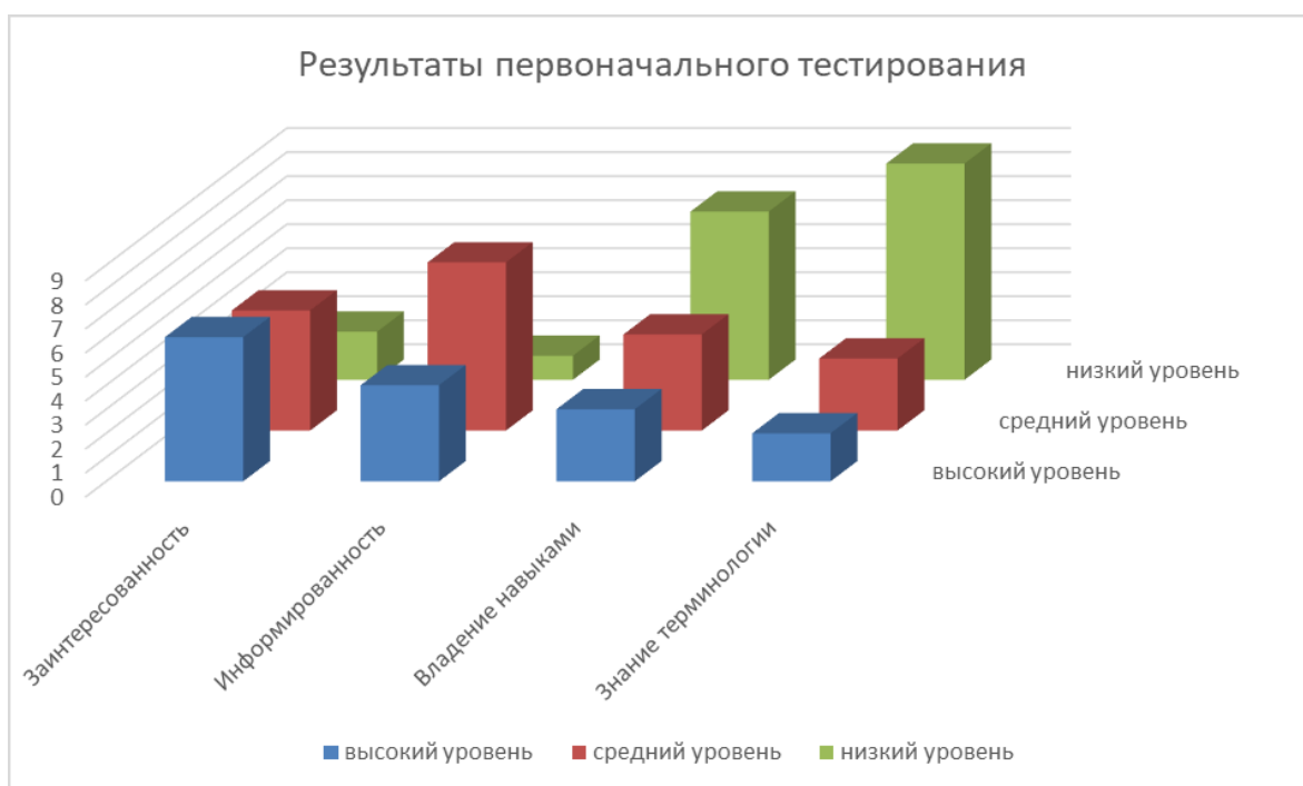
Рис.3. Результаты первоначального тестирования детей